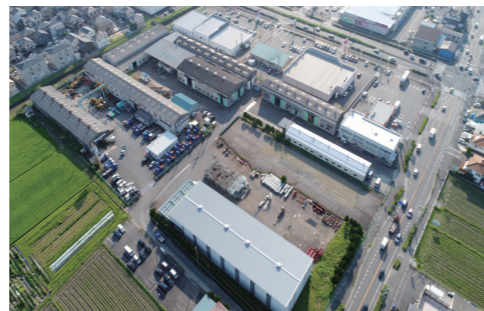
滋賀工場 栗東駅から西(琵琶湖方面)に徒歩20分 約2km 県道31号線沿い

神戸工場 〒651-2228 神戸市西区見津が丘2丁目3番2号 TEL. 078 (994) 6721 FAX. 078 (994) 6728